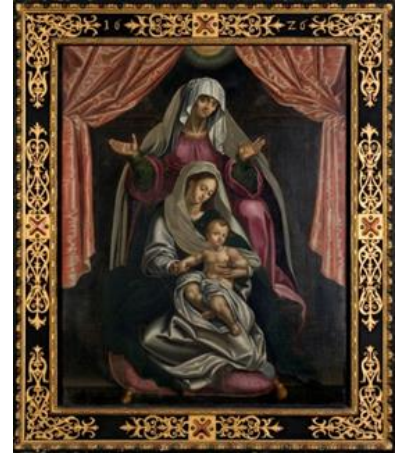
Inconnu, Sainte Anne trinitaire, 1626, huile sur toile, © MAHF/Primula Bosshard