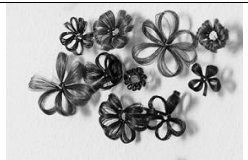
© Fleurs en cheveux par Lorna Bornand.