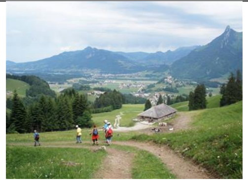
Sentier des fromageries - Gruyères

Dimanche 17 mai, 14h et dimanche 14 juin, 14h