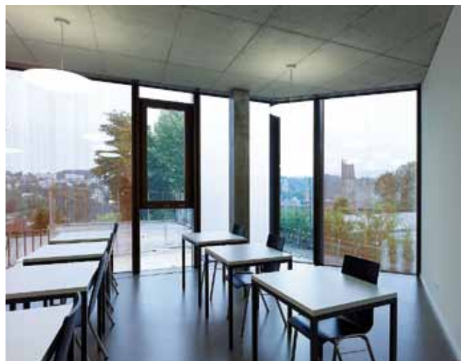
Les salles de cours s'ouvrent largement sur l'environnement extérieur.