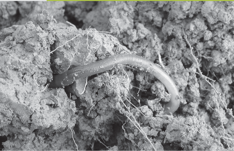
In einer Hand voll gesundem Boden zählt man mehrere Milliarden von Lebewesen, die unter anderem das organische Material (Blätter, usw.) zersetzen. Die Regenwürmer spielen eine besonders wichtige Rolle: ihre Gänge lüften den Boden und ihre Exkremente sind nährstoffreich.