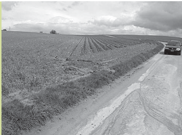
Eine von mehreren Folgen der Erosion: Anschüttungen auf der Strasse, entlang der Wege, in den Kanalisationen, usw., verursachen Kosten für das Abräumen und den Unterhalt der Infrastrukturen