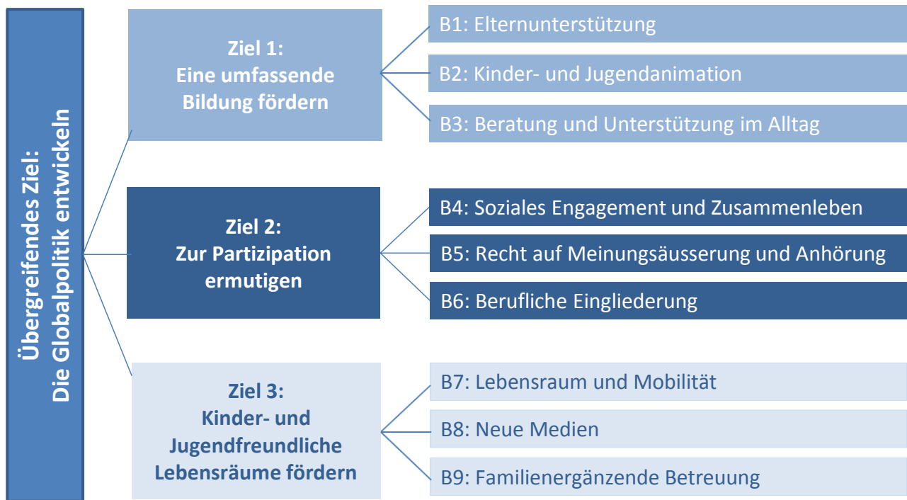
Abbildung 1: Ziele und Handlungsbereiche der kantonalen Kinder- und Jugendpolitik