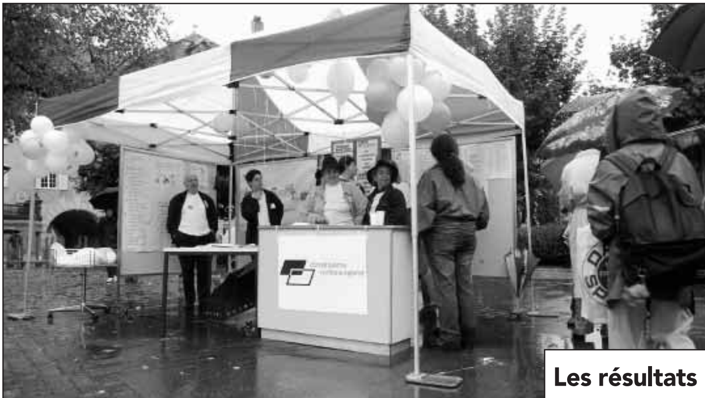
Le stand de la Constituante n'a pas fait courir les foules.

MORAT-FRIBOURG • Huit constituants et trois membres du secrétariat ont pris part à la course. Une opération qui vise à rendre la Constituante davantage visible.