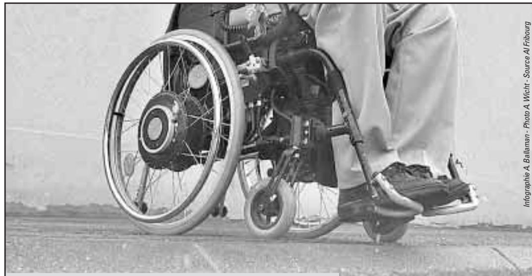
Infographie A. Baillaman - Photo A. Wicht - Source AI Fribourg

Grâce au renforcement du personnel, le temps de traitement des demandes a diminué. Aujourd'hui, une personne qui soumet une demande AI attend 145 jours en moyenne jusqu'à l'octroi de la prestation. «C'est trois mois de moins que la moyenne suisse», relève Philippe Felber. En 2002, le temps d'attente moyen était de 196 jours.