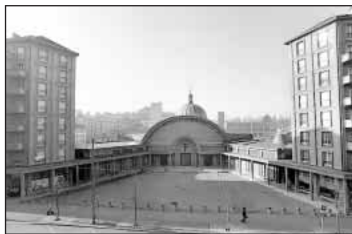
L'architecture de l'église était ambitieuse pour son époque. V. MURITH-A

Les objets liturgiques de Goudji s'ajoutent en effet à d'autres œuvres qui enrichissent le Christ-Roi depuis sa construction, comme les vitraux de Strawinsky et de Yoki, le grand crucifix en bronze d'Apel Fenosa et le chemin de croix d'Armand Niquille.