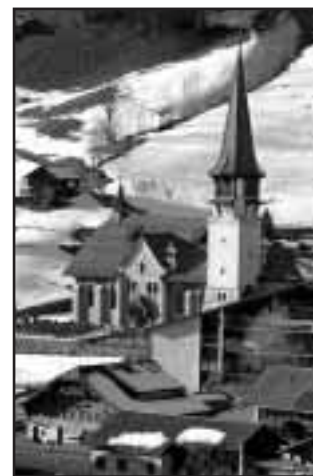
A Bellegarde/Jaun, c'est la liste du PDC-Région qui emporte la majorité des suffrages devant les radicaux et le PDC-Centre. Les autres formations suivent loin derrière. V. MURITH