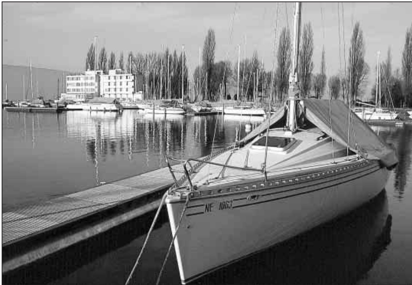
Il y a douze sièges à prendre pour Estavayer-le-Lac et son district.