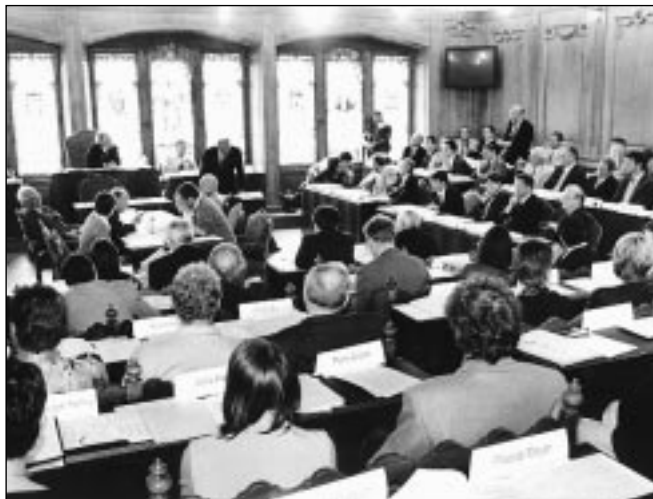
La Constituante quitte Fribourg pour siéger mercredi à Grangeneuve