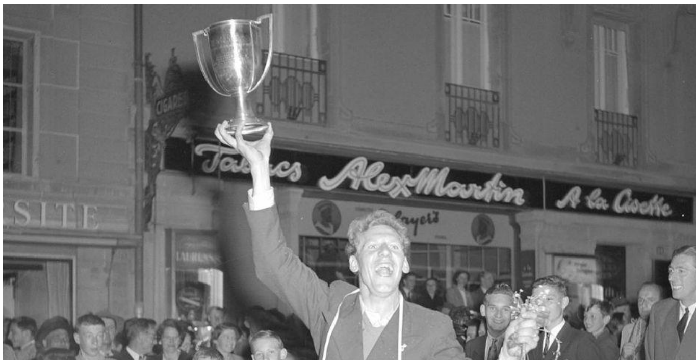
Accession du FC Fribourg en Ligue B, 1952.