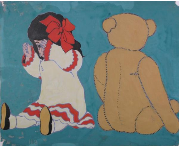
Henri Broillet Poupée et ours en peluche , 1ère moitié du XXe s. Gouache et encre de Chine sur papier