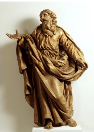
Jean-Jacques Reyff Saint-Paul , 1693 Bois de tilleul, polychromie perdue