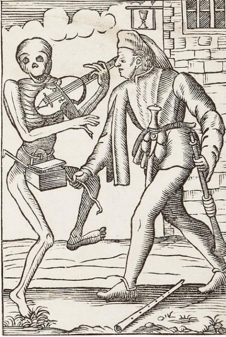
Georges van Sichem Sept scènes de la danse macabre , fin du XVIe s. Gravure sur bois