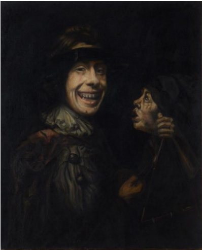
Marcello Le Rieur , vers 1870 Huile sur toile