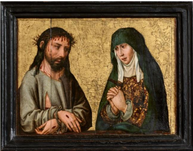
Peintre inconnu Vierge en prière devant un Christ de douleur , dernier tiers du XVe s. Liant huileux sur bois