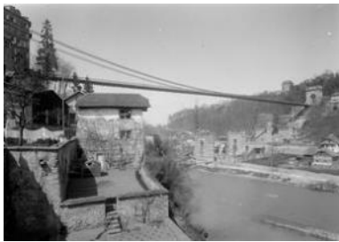
Ancien grand pont suspendu et fondations du pont de Zaehringen, Fribourg