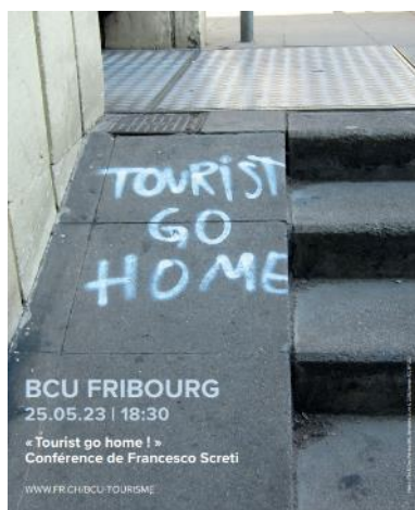
Barcelone © Ted & Dani / CC