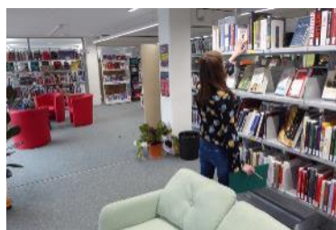
Toutes les dates / Alle Daten