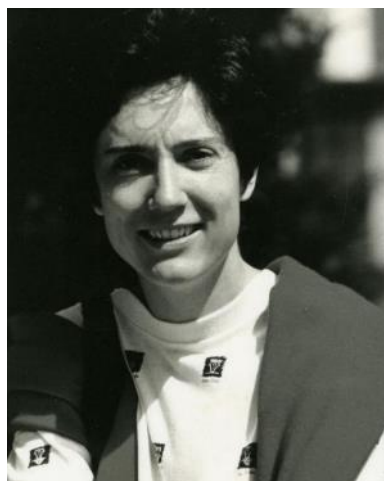
Caroline Charrière / © BCU