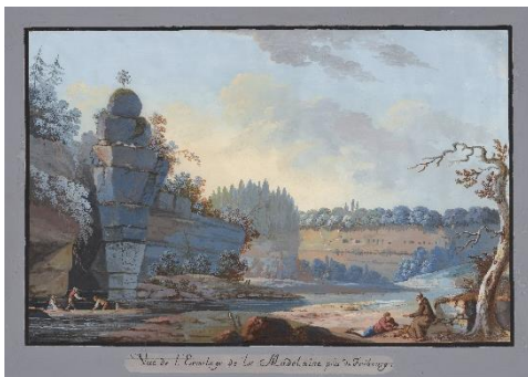
Joseph-Emmanuel Curty Vue de l'Ermitage de la Madeleine , vers 1800 Gouache MAHF 8027