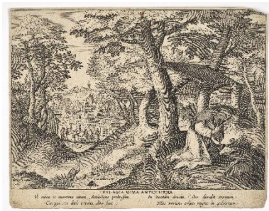
D'après Marten de Vos, Jan Collaert, Cornelis Galle Sainte Pélagie d'Antioche , vers 1580 Taille-douce MAHF 14692 c