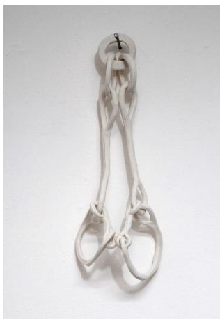
Rachel Labastie Entraves , 2010 Porcelaine modelée