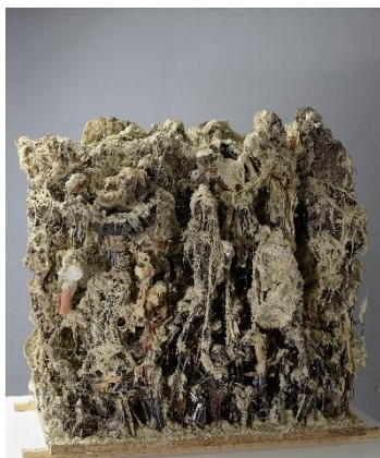
Marc Moret Collage aux grands-papas , 1987 Technique mixte MAHF 2021-201