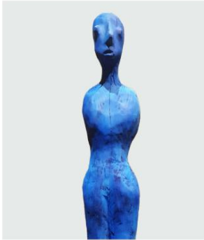
Adrian Fahländer Sentinelle , 2022 Bois peint