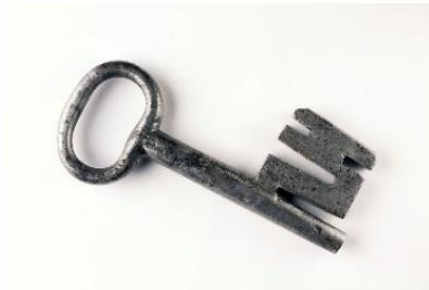
Inconnu Clé de la Mauvaise Tour , sans date Fer forgé MAHF 4343