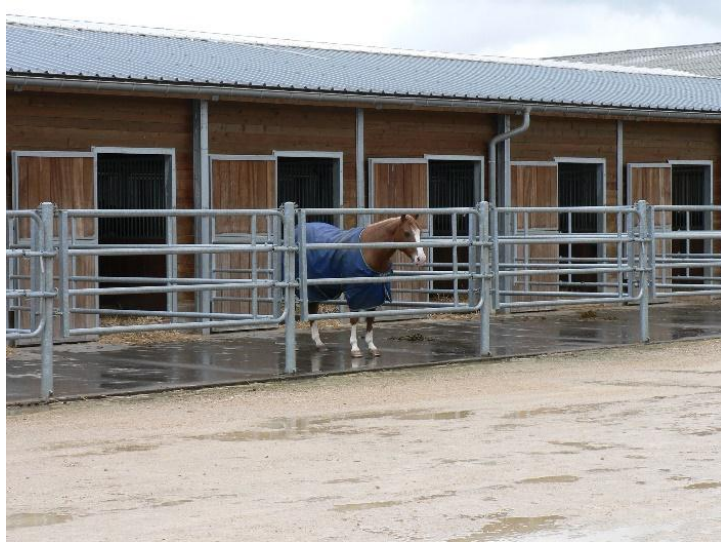
Aire de sortie toutes saisons