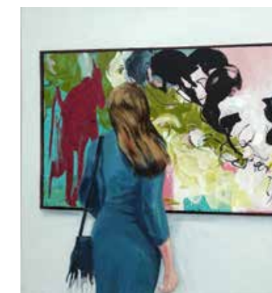
«La vie du singe en trois mouvements», 3 x 130 cm x 120 cm, Pierre-Alain Morel & Wojtek Klakla, 2019