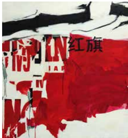
«Drapeau rouge», 130 cm x 120 cm, Pierre-Alain Morel, 2019