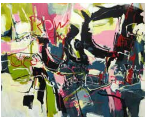
200 cm x 250 cm, Pierre-Alain Morel, 2019