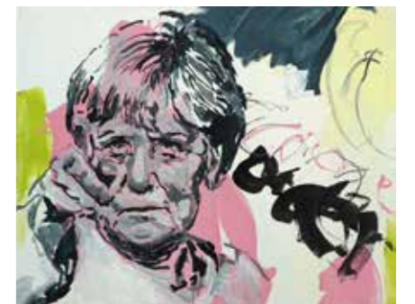
«Président 3», 80 cm x 100 cm, Pierre-Alain Morel, 2019