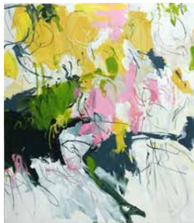
2 x 160 cm x 150 cm, Pierre-Alain Morel, 2019