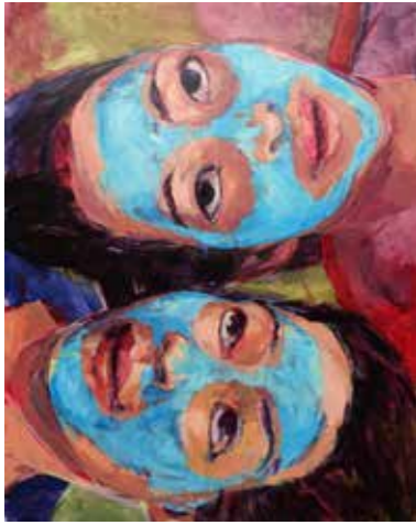
« les jumelles », 250 cm x 200 cm, Wojtek Klakla, 2019