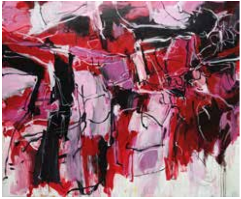
200 cm x 250 cm, Pierre-Alain Morel, 2019