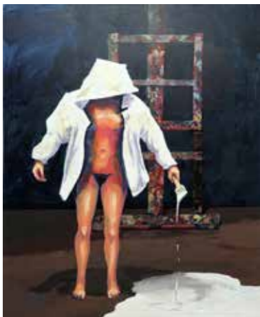
« La femme peintre », 200 cm x 200 cm, Wojtek Klakla, 2019