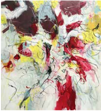
160 cm x 150 cm, Pierre-Alain Morel, 2019