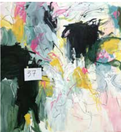
160 cm x 150 cm, Pierre-Alain Morel, 2019