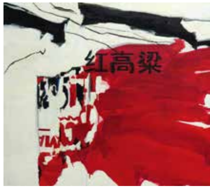
«Sorgho rouge», 120 cm x 130 cm, Pierre-Alain Morel, 2019