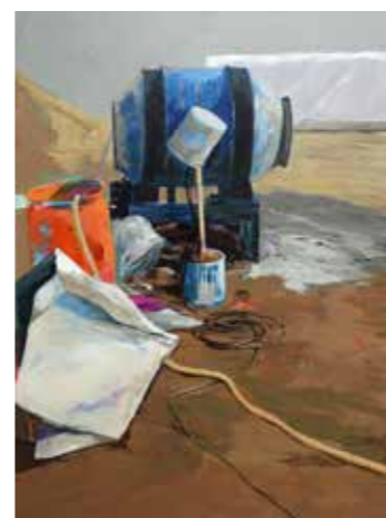
«Betonière», 200 cm x 150 cm, Wojtek klakla, 2019