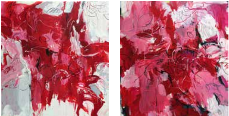
2 x 160 cm x 150 cm, Pierre-Alain Morel, 2019