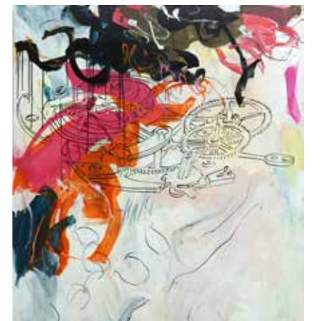
« Montre suisse 3 », 170 cm x 150 cm, Pierre-Alain Morel, 2019