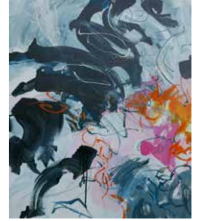
100 cm x 80cm, Pierre-Alain Morel, 2019