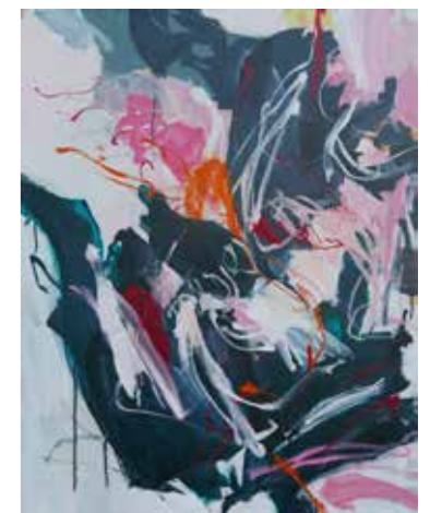
100 cm x 80 cm, Pierre-Alain Morel, 2019