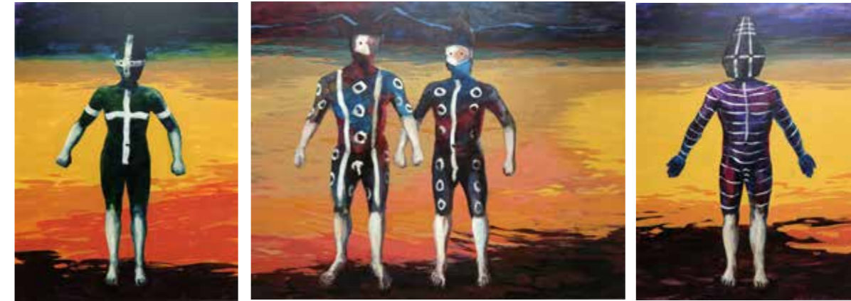
«Le Fleuve Jaune», 200 cm x 150, 200 cm x 250 cm, 200 cm 150 cm, Wojtek Klakla, 2019