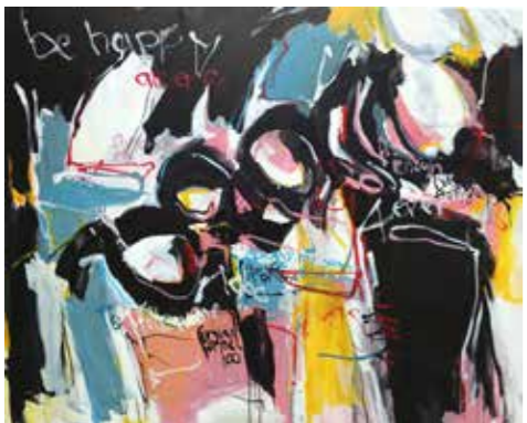
200 cm x 250 cm, Pierre-Alain Morel, 2019