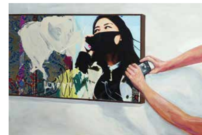
2 x 100 cm x 150 cm, Pierre-Alain Morel & Wojtek Klakla, 2019