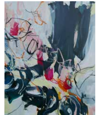
100 cm x 80 cm, Pierre-Alain Morel, 2019