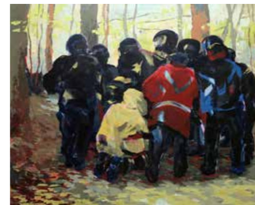
«Le cercle des poètes disparus» 200 cm x 250 cm, Wojtek Klakla, 2019