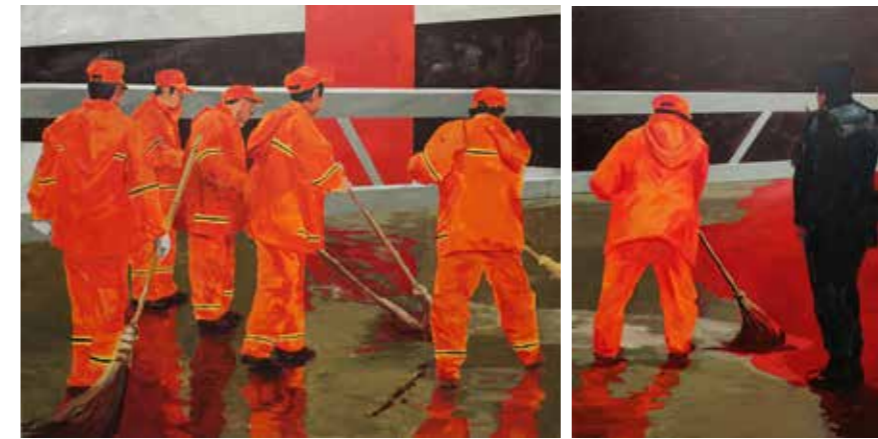
«Le sang versé par le peuple», 200 cm x 250 cm, 200 cm 150 cm, Wojtek Klakla, 2019