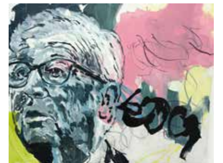
«Président 2», 80 cm x 100 cm, Pierre-Alain Morel, 2019