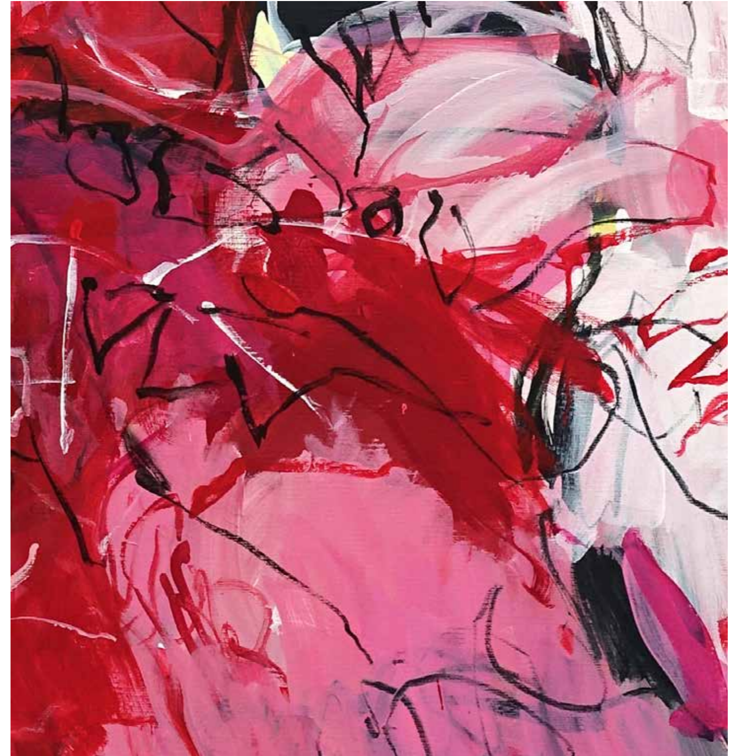
détail, Pierre-Alain Morel, 2019