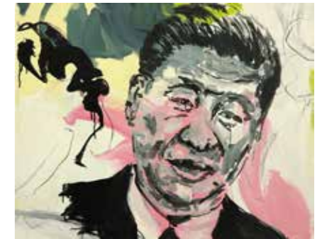
«Président 1», 80 cm x 100cm, Pierre-Alain Morel , 2019