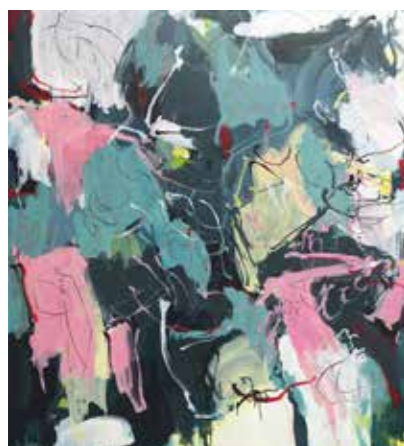
160 cm x 150 cm, Pierre-Alain Morel, 2019