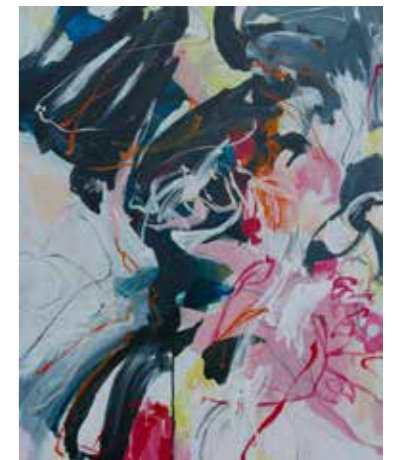
100 cm x 80 cm, Pierre-Alain Morel, 2019