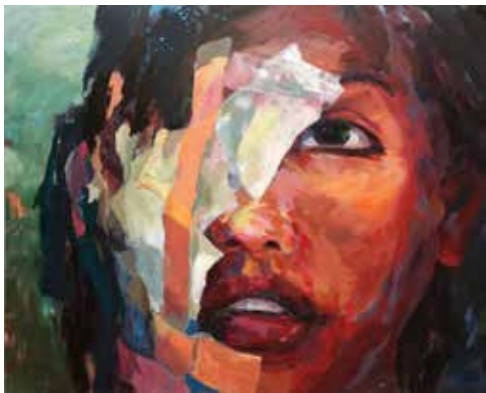
« La fille blessée », 200 cm x 250 cm, Wojtek Klakla, 2019