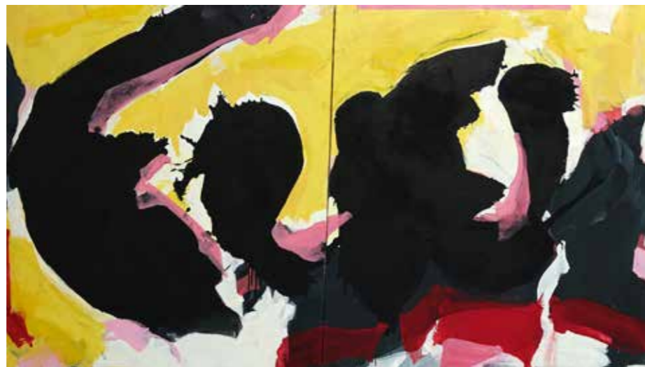
130 cm x 240 cm Pierre-Alain Morel 2019