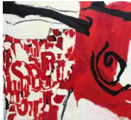
«Rouge», 120 cm x 130 cm, Pierre-Alain Morel, 2019