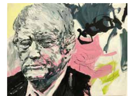
«Président 4», 80 cm x 100 cm, Pierre-Alain Morel, 2019