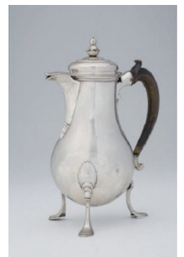
objets du quotidien