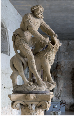
sculpture sur pierre