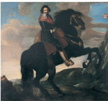
sculpture sur bois