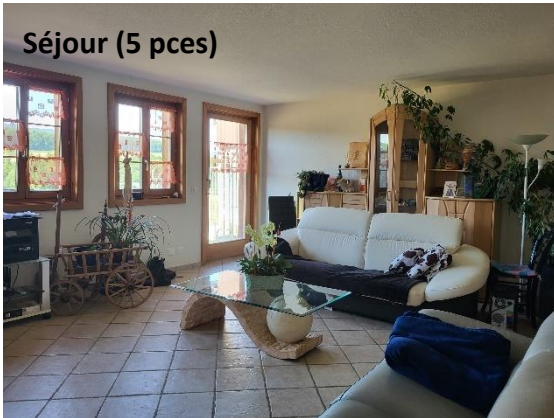
Séjour (5 pces)