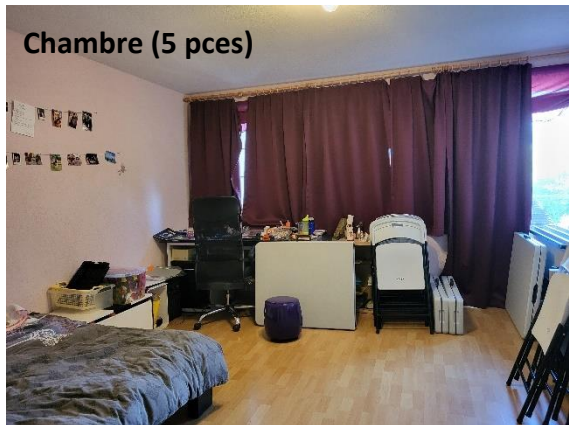
Chambre (5 pces)