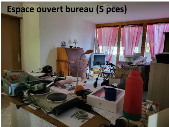
Espace ouvert bureau (5 pces)