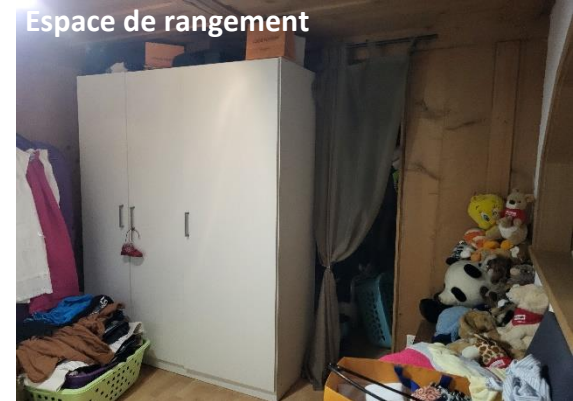
Espace de rangement