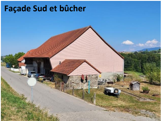
Façade Sud et bûcher