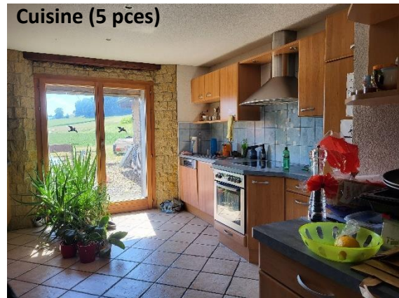
Cuisine (5 pces)