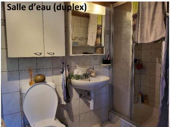
Salle d'eau (duplex)