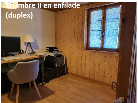
Chambre II en enfilade (duplex)