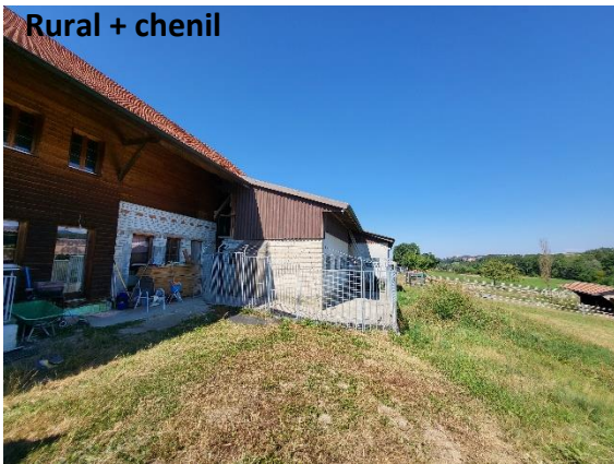
Rural + chenil