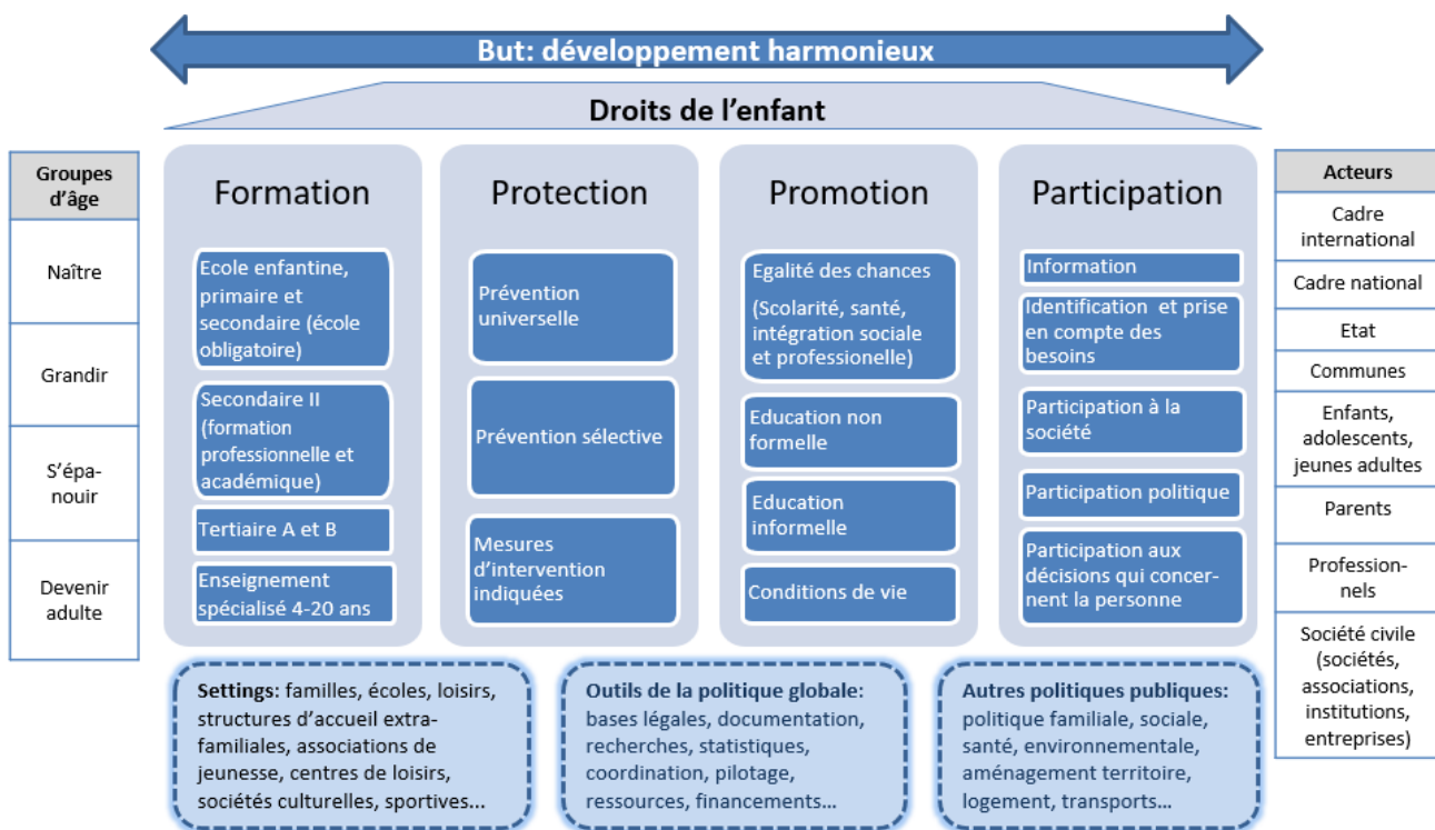
Figure 1 : conception directrice de la politique fribourgeoise de l'enfance et de la jeunesse basée sur quatre piliers

Cette conception cantonale définit la politique de l'enfance et de la jeunesse comme globale et transversale. La mise sur pied et le maintien de conditions-cadres en adéquation avec les besoins de l'enfant relèvent en effet de la coresponsabilité des différents acteurs publics et associatifs impliqués.