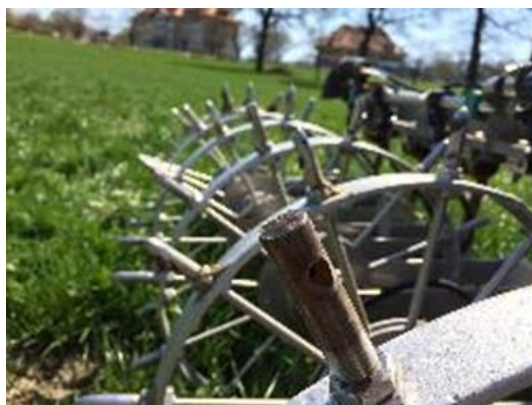
Le système CULTAN injecte l'azote sous forme de sulfate d'ammoniaque dans le sol. Les pertes sont censées être moins importantes ; il n'a pas été possible de mesurer un rendement différent de celui obtenu avec l'urée.