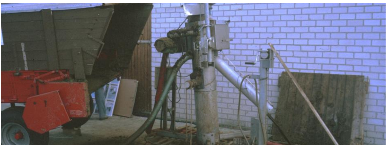
Séparateur de lisier