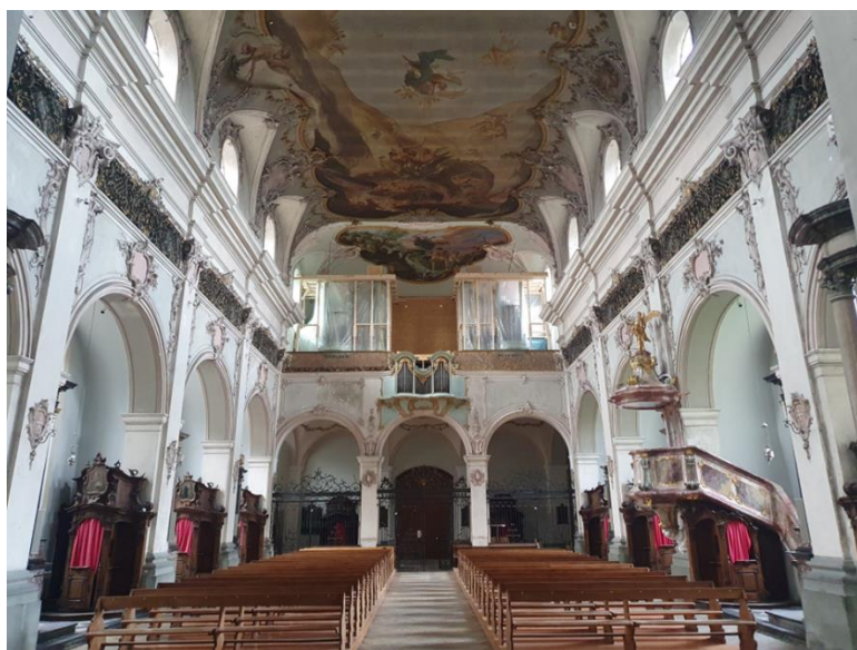
Figure 1 Nef de l'église – vue du chœur vers la tribune dont la voûte a été restaurée

Cette campagne de travaux de restauration a permis de restaurer une première travée de la voûte de la nef et la toiture de la chapelle St-Nicolas de Flüe. Elle a révélé la nécessité d'une intervention urgente pour garantir la sauvegarde de l'église. Les travaux de restauration ont redonné aux stucs et peintures une nouvelle jeunesse éclatante, tout en respectant leur substance et leur patine. Les travaux sur le reste de la voûte, qui se poursuivent depuis début 2025 jusqu'en mai 2026, visent à préserver et consolider cet élément essentiel de l'église.