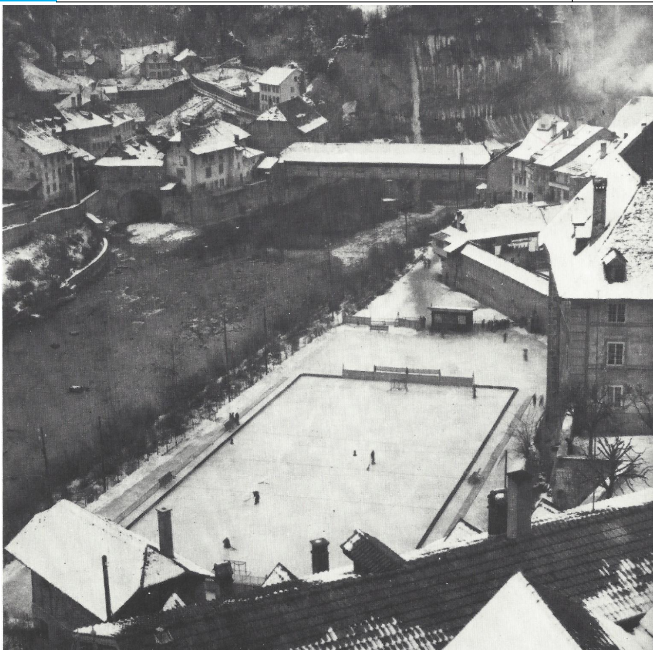
La nouvelle patinoire artificielle

S'en suivirent plusieurs décennies en ligue nationale B, mais le club changea de nom en 1967 pour devenir le HC Fribourg. L'infrastructure fut peu à peu agrandie, avec des bandes et des tribunes plus grandes. En 1970, des vestiaires furent construits. En 1973, la patinoire fut recouverte d'une bâche afin de pouvoir jouer indépendamment des conditions météorologiques.