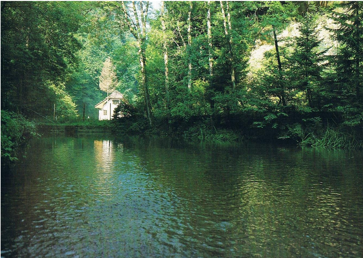
L'étang du Gottéron

Dans la première moitié du 20 e siècle, les patinoires naturelles étaient rares en Suisse et les patinoires artificielles encore plus. À Fribourg, la plupart des patineurs se retrouvaient sur l'étang gelé du Jura ou dans la fosse de la Chassotte. Bien qu'un club de hockey sur glace ait été créé dans ce quartier, les joueurs étaient considérés comme indésirables par les adeptes du patinage artistique et le sport n'a pas pu se développer comme il le souhaitait.