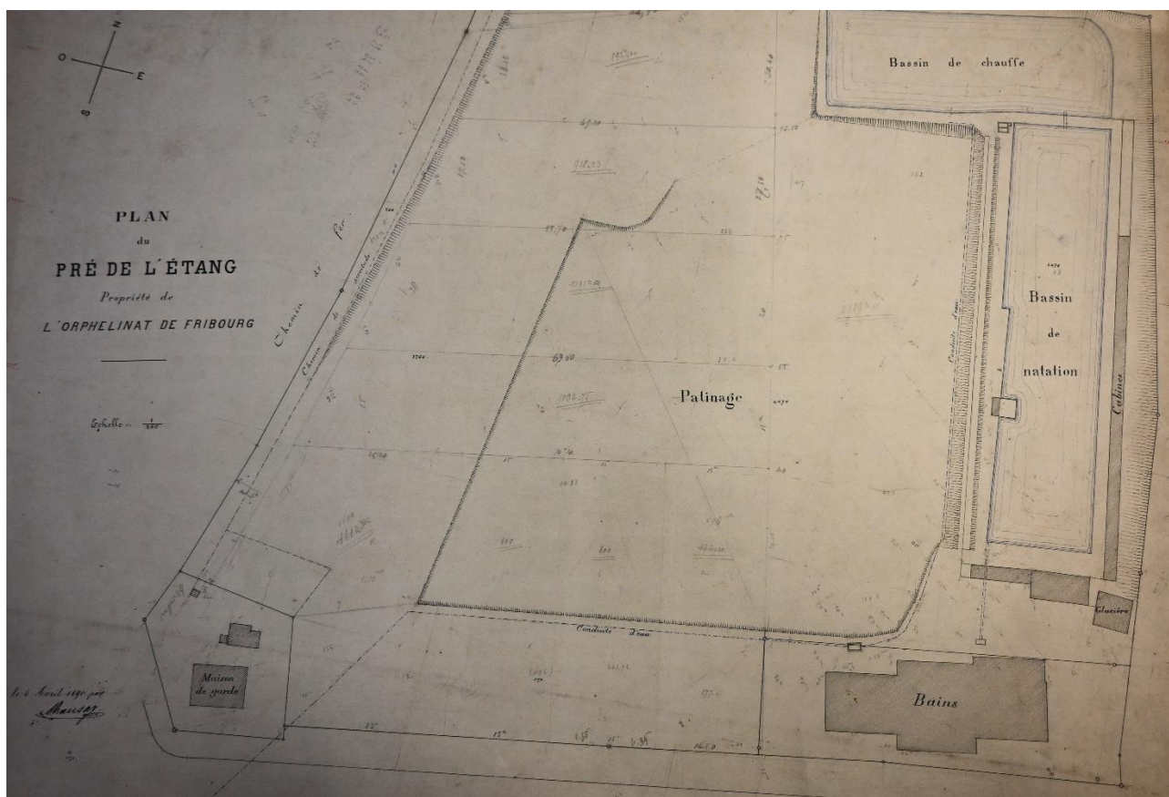
Plan de la patinoire près de la Motta, 1890

Au pied de l'église Saint-Maurice, l'ancien couvent des Augustins, se trouvait une friche de 3200m 2 appartenant au canton. Elle a été remblayée en 1921 pour la construction du pont de Zähringen. Il a d'abord fallu la défricher et l'aplanir. La ville de Fribourg a soutenu les jeunes pour les travaux en mettant à disposition des chômeurs. En même temps, elle a fait preuve de retenue, surtout lorsqu'elle a été sollicitée pour des outils au profit de l'entreprise. En fait, la ville avait prévu d'installer une patinoire près de la piscine de la Motta.