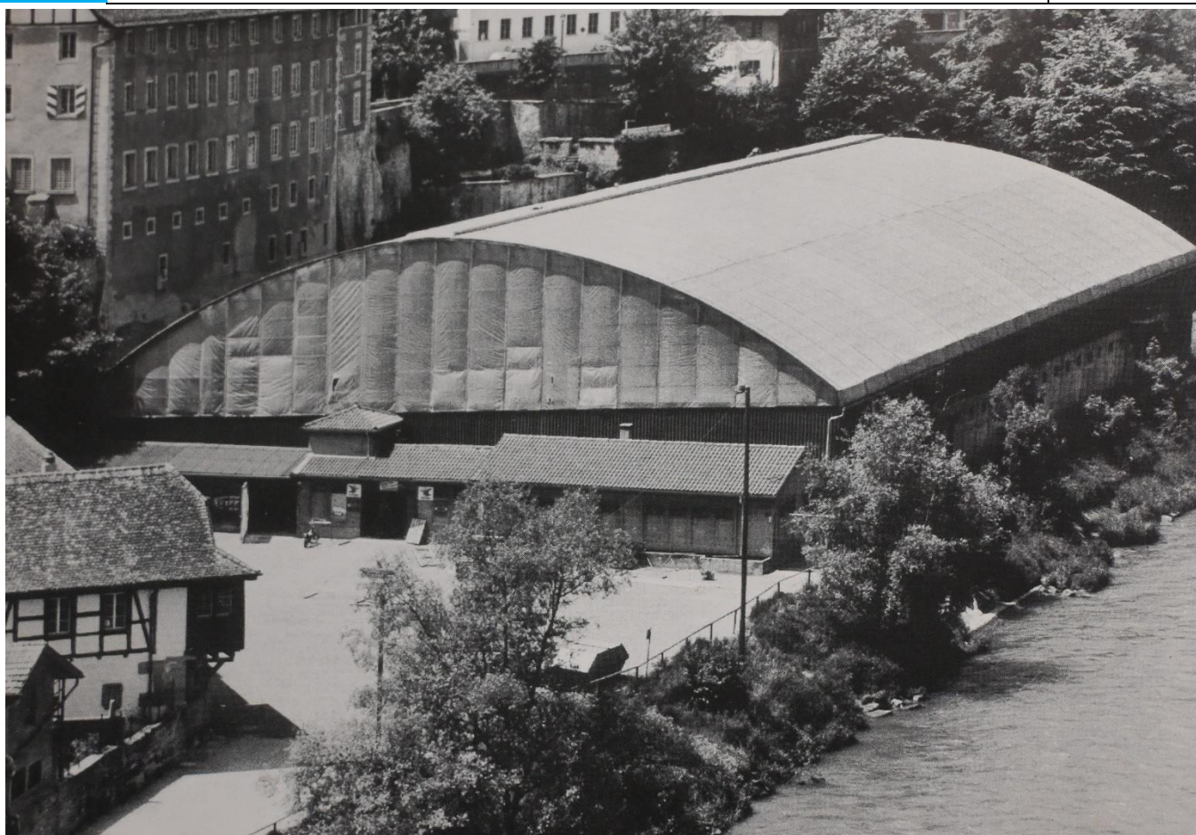
La patinoire des Augustins juste à côté de la Sarine

Cette extension pour de meilleures conditions d'entraînement et de match n'a cependant pas pu empêcher le HC Fribourg d'être relégué en 1re ligue en 1976. Deux ans plus tard, le HC Fribourg accède à la Ligue nationale A et se maintient depuis lors sans interruption au plus haut niveau du hockey sur glace suisse.