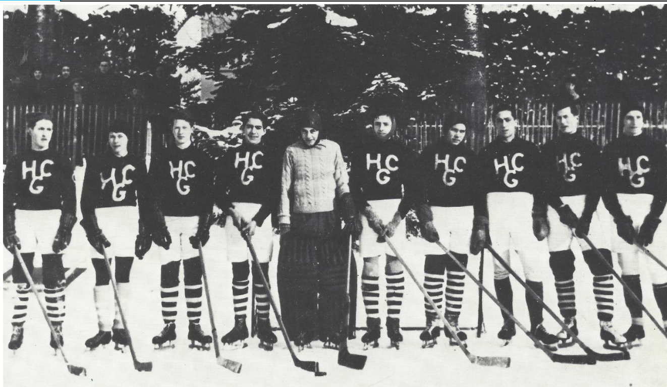
HC Gottéron, sans date

D'autres équipes se sont formées dans le quartier, comme le HC Tirlibaum et le HC International. Le HC Gottéron s'impose rapidement sur le plan sportif et les différents joueurs sont intégrés dans le HC Gottéron. Le besoin d'une surface de glace normalisée s'est fait sentir et c'est ainsi qu'un nouveau terrain a pu être construit chez les Augustins, avec beaucoup d'assiduité et de travail bénévole.