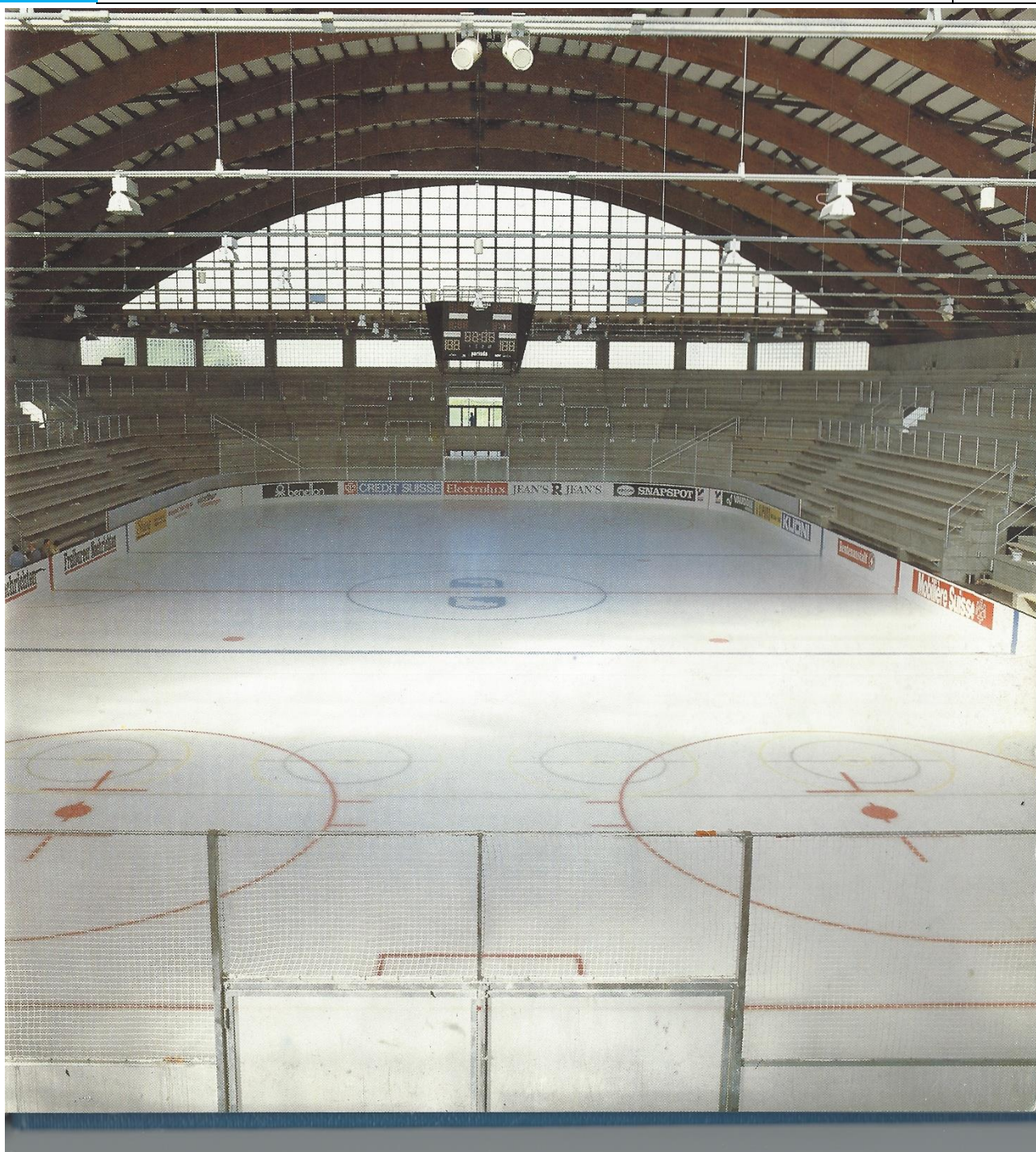
Vue3 intérieure de la nouvelle patinoire