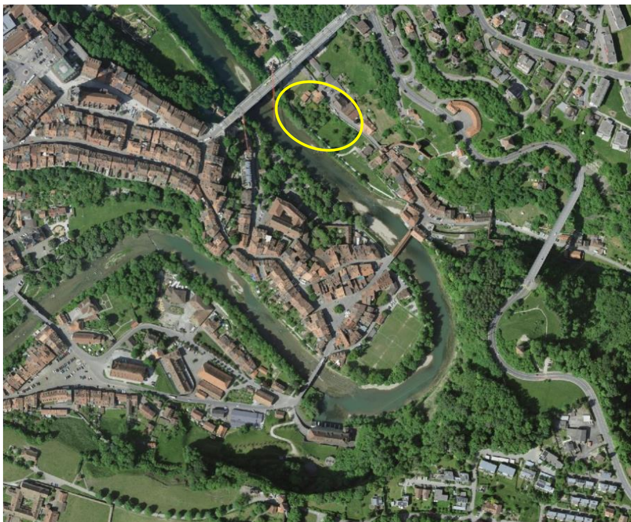
Plan de situation des Augustins (aujourd'hui un parking)

Durant l'hiver 1939/1940, l'étang du Gottéron, utilisé au début, devint trop petit pour le HC Gottéron en pleine croissance et le niveau croissant des joueurs. C'est ainsi que les premiers essais de glace ont été effectués aux Augustins.