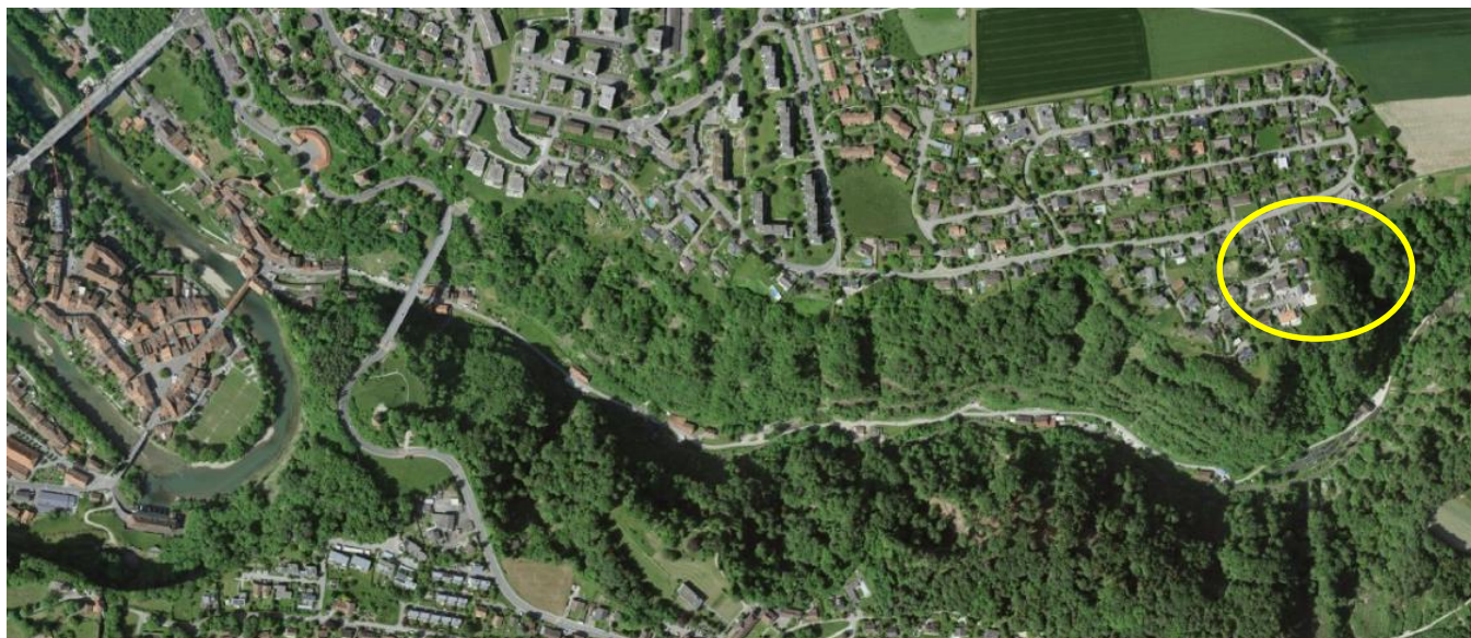
Plan de situation de l'étang du Gottéron (à gauche, le quartier de l'Auge)

Inspirés par les retransmissions radio des exploits de l'équipe suisse, ils jouaient déjà au hockey sur glace depuis deux ans sur l'étang de la pisciculture du Gottéron (étang du Gottéron).