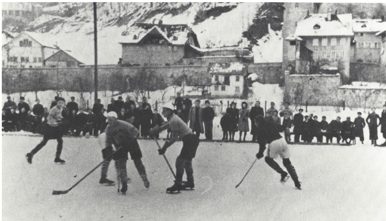
Match amical aux Augustins contre Polar Bern

partie de bowling. Les matchs étaient organisés en fonction de la météo. S'il y avait de la glace, l'adversaire était convoqué.