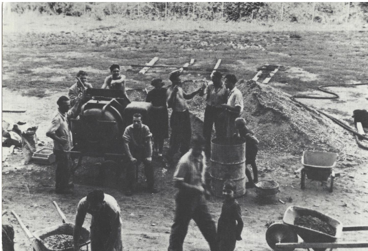
Les habitants du quartier de l'Auge en action près des Augustins

Sur le plan sportif, le prochain défi du HC Gottéron était l'admission à la Fédération suisse de hockey. En effet, aucun des jeunes membres n'ayant atteint la majorité, une admission provisoire a d'abord été approuvée. Au cours de ces deux premières années provisoires, seuls des matchs amicaux étaient possibles.