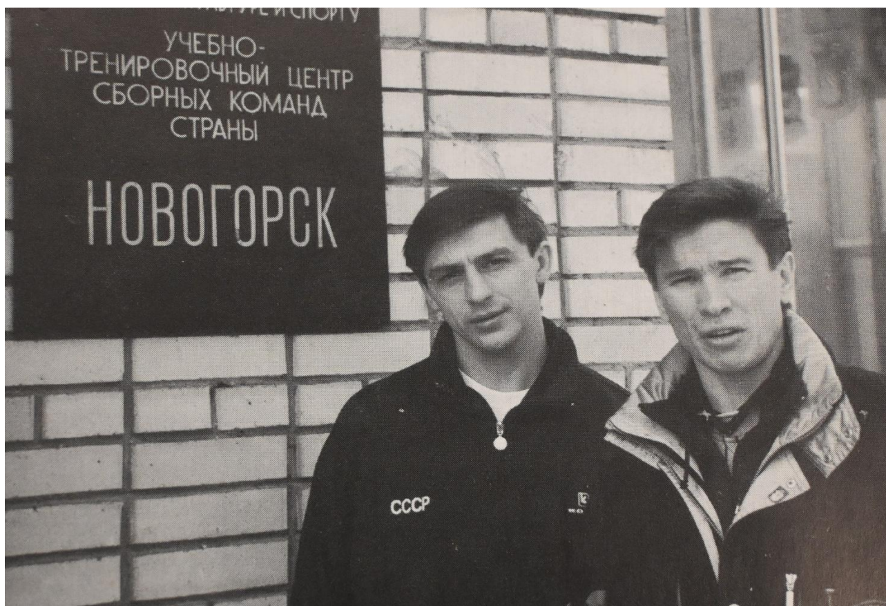
Andrej Chomutow (à gauche) et Slava Bykow avant leur départ pour Fribourg

Entre 1992 et 1994, le HC Fribourg-Gottéron atteint même trois fois la finale des play-offs, mais ne parvient jamais à la gagner. C'était l'ère Bykow/Chomutow. Slava Bykow, capitaine de la Sbornaja, la redoutable équipe de l'URSS, et Andrej Chomutow, meilleur buteur du dernier Championnat du monde à Stockholm, rejoignent Gottéron. Dans le milieu du hockey sur glace suisse, on parle du « transfert du siècle ».