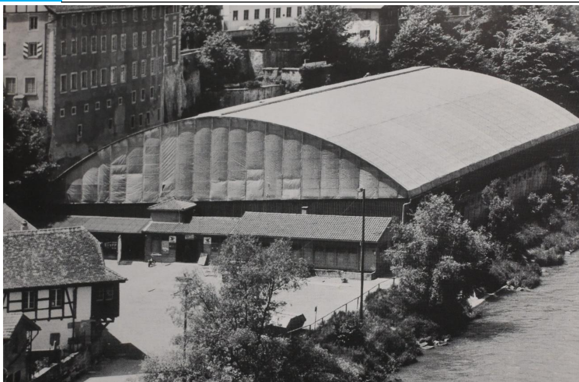
La patinoire des Augustins directement à côté de la Sarine

En 1978, le HC Fribourg réussit à monter en Ligue nationale A pour rester depuis lors sans interruption au plus haut niveau du hockey sur glace suisse.