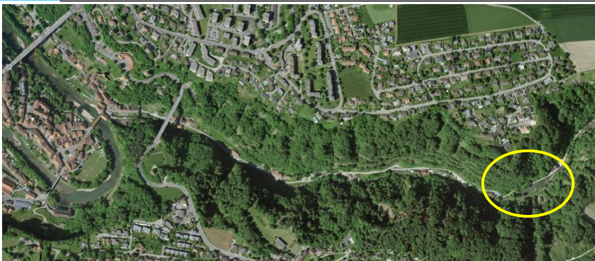
Plan de situation de l'étang du Gottéron (à gauche, le quartier de l'Auge)

Rapidement, le groupe s'agrandit et les joueurs s'occupent de la patinoire à la main et fabriquent des crosses en bois de frêne du Gottéron. Pour se protéger du puck, les joueurs fabriquent eux-mêmes les protections. Au début, le gardien de but est simplement enveloppé de jute et utilise une planche de bois au lieu d'une canne. Cela n'était pas suffisant. Les joueurs inventent donc un équipement volumineux : d'épais coussins renforcés de roseaux servent à protéger la cage thoracique et l'abdomen, et les jambières sont fabriquées à partir de vieux sièges de voitures en fin de vie. La première canne de gardien de but est achetée à Berne par une délégation du club qui s'y rend à vélo.