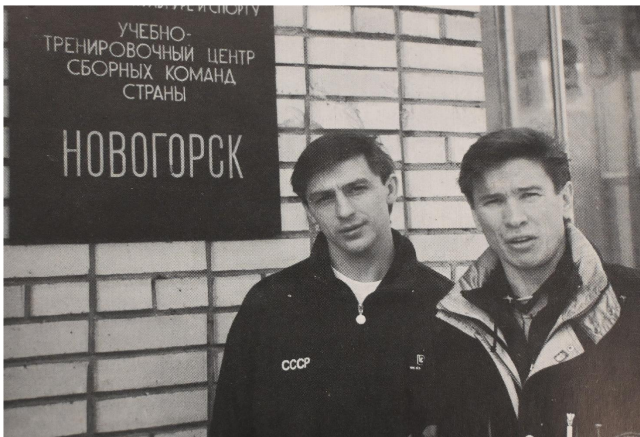
Andrej Chomutow (à gauche) et Slava Bykow avant leur départ pour Fribourg

Entre 1992 et 1994, le HC Fribourg-Gottéron atteint même trois fois la finale des play-offs, mais ne parvient jamais à la gagner. C'est l'ère Bykow/Chomutow. Slava Bykow, capitaine de la Sbornaja, la redoutable équipe de l'URSS, et Andrej Chomutow, meilleur buteur du dernier Championnat du monde à Stockholm, rejoignent les Dragons. Dans le milieu du hockey sur glace suisse, on parle du « transfert du siècle ».