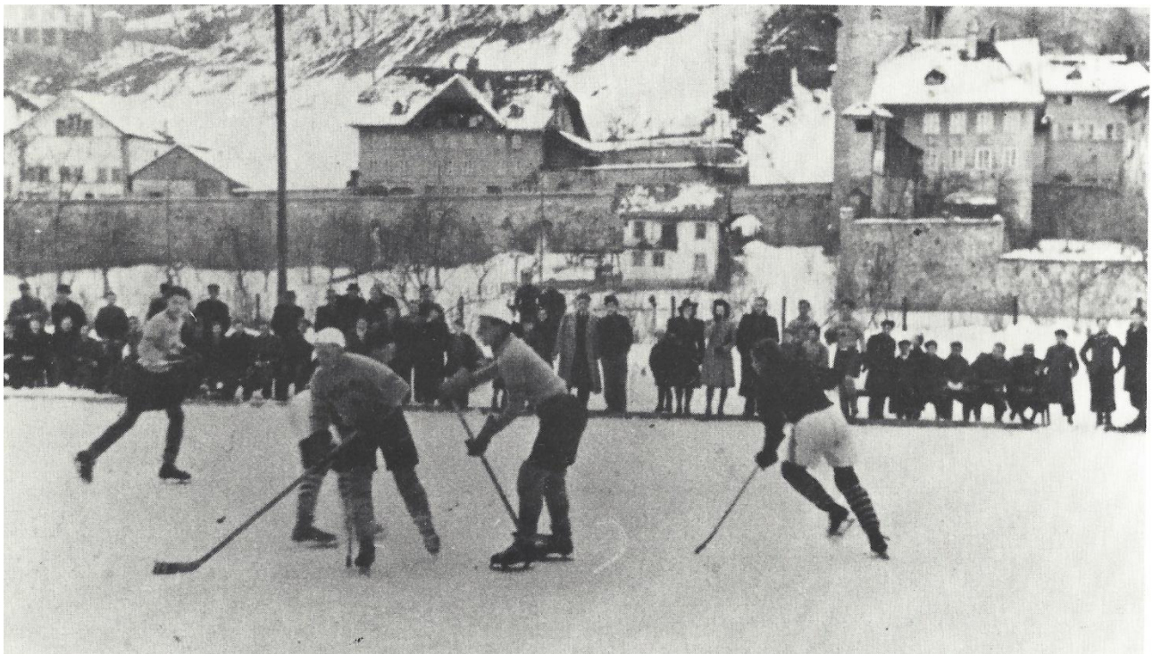
Match amical aux Augustins contre Polar Bern

En 1945, Walter Essig devient le premier entraîneur du HC Gottéron. La patinoire est encore optimisée et des tribunes pour les spectateurs sont construites en plus de 60 heures de travail bénévole, puis agrandies par la suite. En 1947, le HC Gottéron est promu en série A (1 re ligue) sous la direction de Walter Essig. En 1953, il est même promu en ligue nationale B.