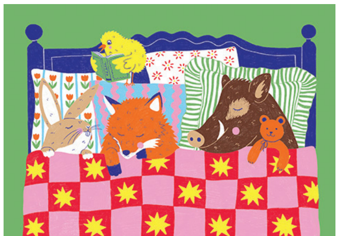
Illustration : Selina Gerber - wopico

Surprise en entrant dans l'exposition : il y fait drôlement sombre. Attirés par quelques lumières diffuses, les visiteurs et visiteuses découvrent quels animaux sont actifs la nuit et lesquels dorment. Dans la deuxième partie,