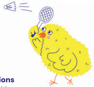
Illustration : Selina Gerber – wapico

Une exposition du Musée d'histoire naturelle de Fribourg (MHNF), réalisée en collaboration avec wapico