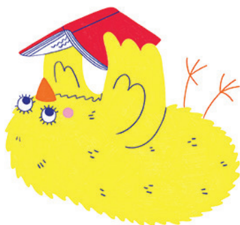
Illustration : Selina Gerber – wapico