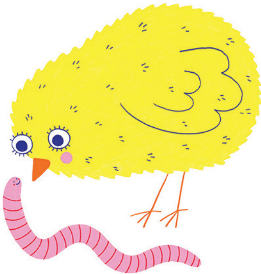
Illustration : Selina Gerber - wapi.co

Concernant les poussins de l'exposition, il n'y a aucun danger : ils éclosent dans le musée et n'ont aucun contact avec le monde extérieur pendant toute la durée de leur séjour.