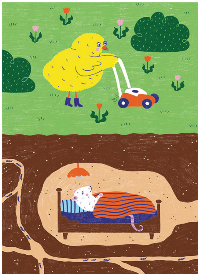
Illustration : Selina Gerber - waplco