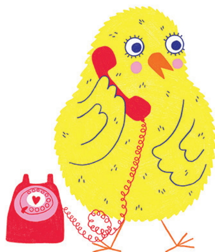
Illustration : Selina Gerber - wapico

Pour toutes les activités : renseignements, prix et inscription sur www.mhnf.ch ou au 026 305 89 00.