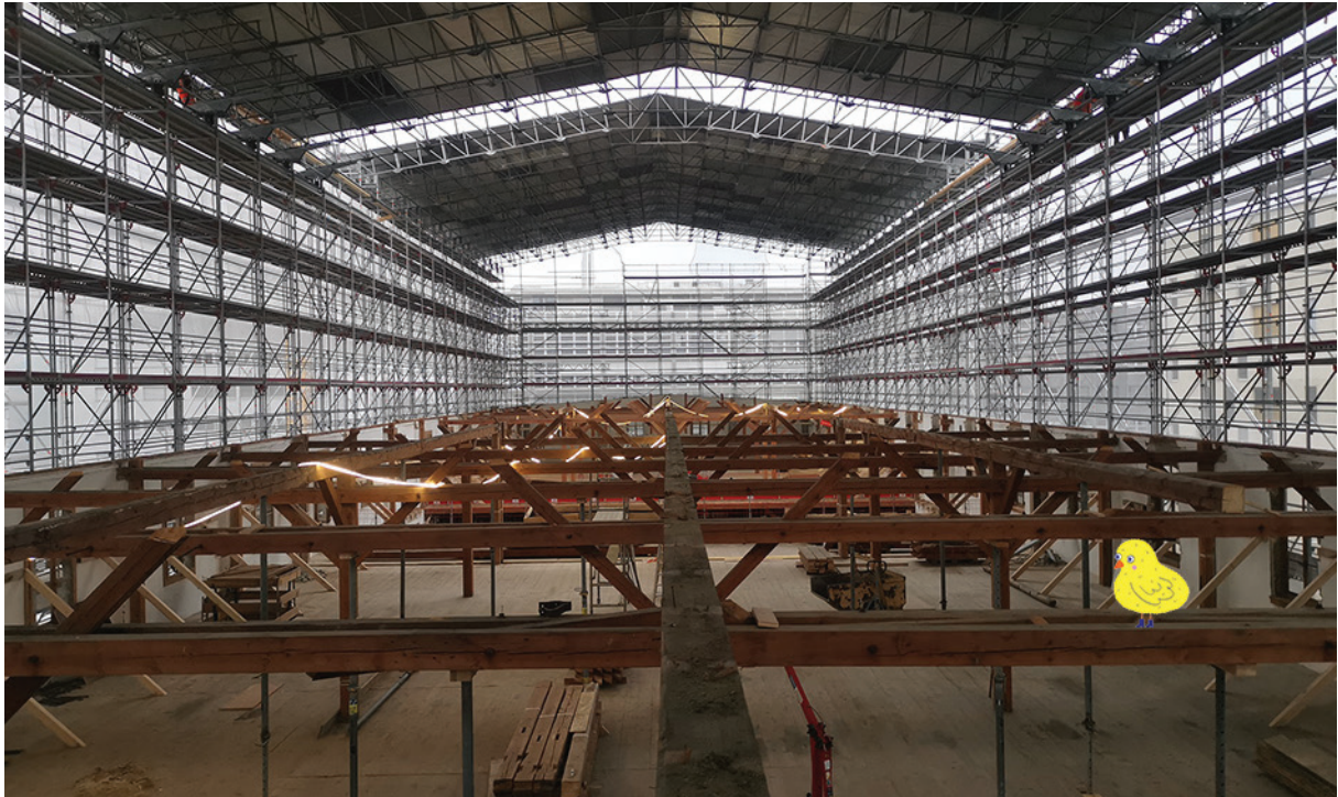
Photo: Zamparo Architectes / Illustration: Selina Gerber - wapi.co