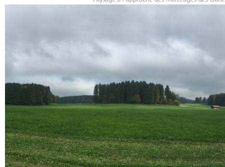
Paysage à l'approche des marécages des Gurles