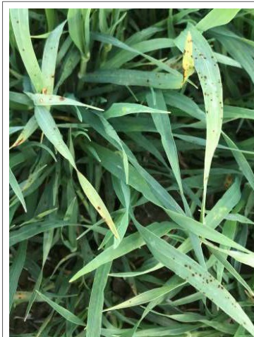
Taches d'helminthosporiose sur orge.

Les fiches techniques Agridea 2.53.4 et 2.59.2 vous donnent des informations supplémentaires concernant les maladies et les meilleurs fongicides disponibles. Pour toutes les interventions, laisser un témoin non traité afin de voir l'efficacité du traitement.