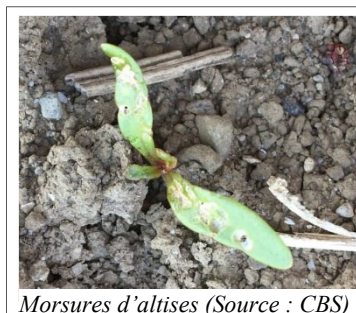
Morsures d'altises

L'unique enrobage de semences homologué en PER est le Force 20 CS (pyréthrinoïde). Cet insecticide a une efficacité de contact contre certains ravageurs souterrains (vers fil de fer, atomaire, collemboule). Mais comme il n'est pas systémique, il n'a aucune efficacité contre les insectes aériens tels que l'altise, la mouche de la betterave, les pucerons ou la teigne. Dès la levée, surveiller la présence et les dégâts de ces insectes. Hormis pour le Pirimor contre les pucerons noirs, toute intervention insecticide est soumise à autorisation . La lutte contre le puceron vert (vecteur de viroses) sera coordonnée dans le cadre d'un réseau entre les services phytosanitaires cantonaux et le CBS.