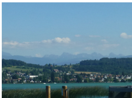
Panorama depuis Sugiez : la plage est idéale pour se baigner et se reposer