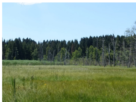
Mosses de la Rogivue : une réserve naturelle à la diversité fascinante (point n°6)