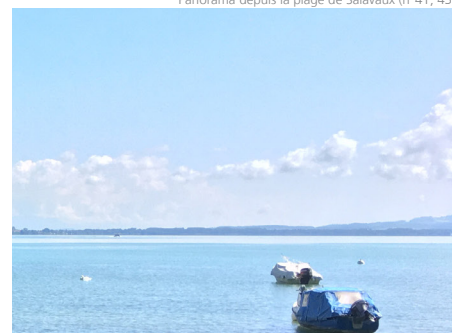
Panorama depuis la plage de Salavaux (n°41, 43)