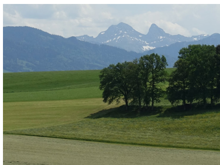
Panorama depuis Magnedens : un lieu de pause apprécié sur l'itinéraire (point n°8)