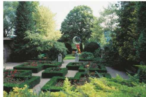
Vue du jardin à la française, avec La Grande Lune (1985/1992), Niki de Saint Phalle

Les jardins du MAHF servent d'écrin à des sculptures monumentales.