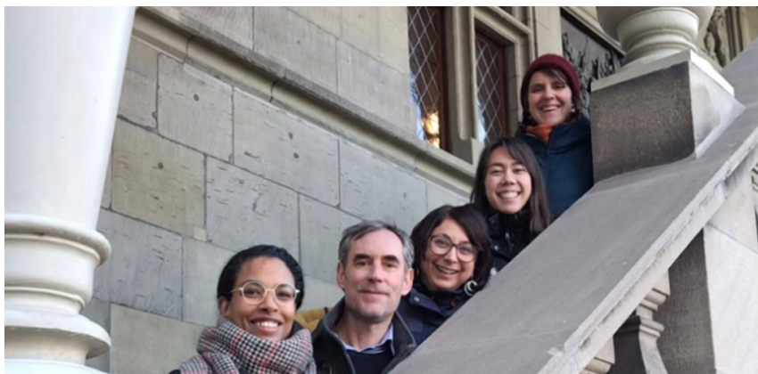
Auf dem Foto fehlen: Brigitte Gong und Anastasia Lanini