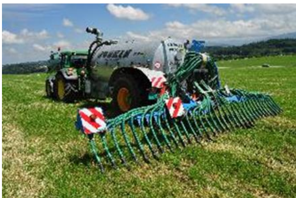
Gülle wird am besten verwertet, wenn sie Ende Winter ausgebracht wird, auf kühlen Boden. Die Verwertung vom Stickstoff nimmt ab der zweiten Gabe ab und wird während dem Sommer negativ, egal welcher Dünger eingesetzt wird.

Ammonsalpeter ist ein sehr guter Dünger, welcher bei ungünstigen Bedingungen zum Ausbringen von Gülle angewendet werden kann. Aber die beste Variante, um Stickstoff zu verwerten, bleibt der effiziente Einsatz von Gülle, der ersten Ressource zur Verfügung auf jedem Betrieb.