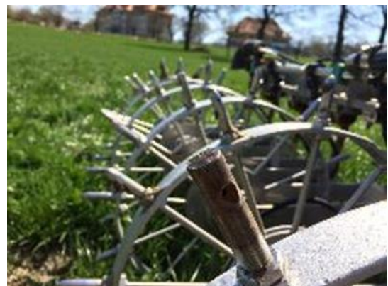
Das System Cultan injiziert den Stickstoff in Form von Ammoniumsulfat in den Boden. Die Verluste sollten kleiner sein, es konnte kein Ertragsunterschied im Vergleich zur Harnstoffdüngung beobachtet werden.