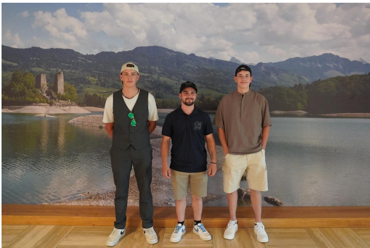
Les lauréats AFP lors de la remise des diplômes, le 2 juillet 2025