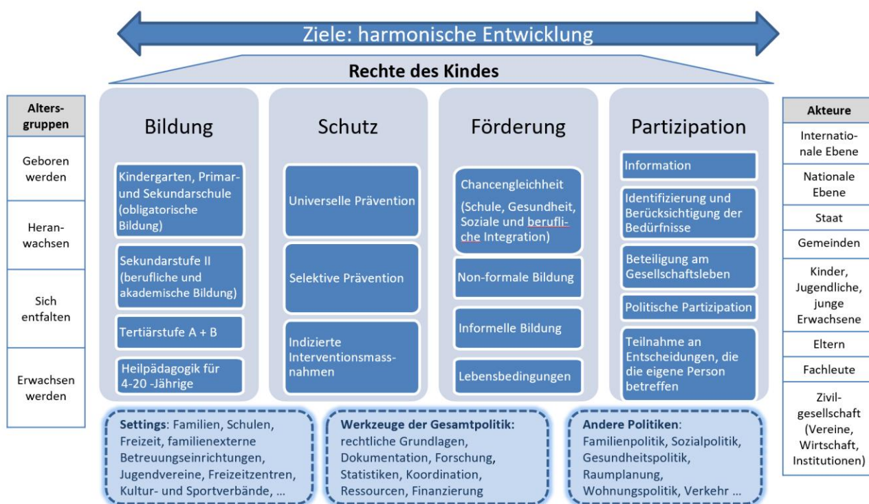
Abbildung 1: Auf vier Säulen basierendes Leitbild für die Freiburger Kinder- und Jugendpolitik

Tatsächlich sind für die Schaffung und Aufrechterhaltung von Rahmenbedingungen, die den Bedürfnissen der Kinder entsprechen, die verschiedenen involvierten staatlichen Akteurinnen und Akteure und Vereine mitverantwortlich.