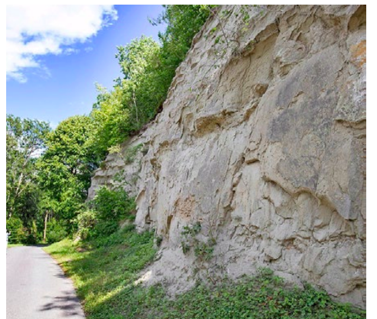
Le Mont-Vully ne présente pas que des attraits touristiques. On peut observer ses molasses et un bloc erratique (en bas à g.) appelé «Pierre Agassiz». Jessica Genoud

sur le Plateau, venait buter contre le Jura et s'étendait jusque dans la région bernoise de Wangen an der Aare.