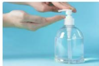
Hygiene, Prävention und Infektionskontrolle (IPK)