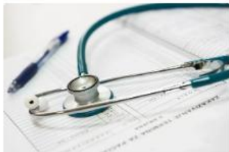
Fachpersonen der Gesundheitsberufe und Institutionen