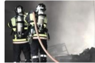
Ausserordentliche sanitäre Situationen