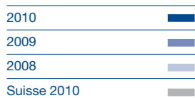
Taux de chômage comparaison 2008/2009/2010 et comparaison Fribourg/Suisse 2010

Les chômeurs étaient ainsi 4 039 dans le canton de Fribourg en moyenne mensuelle. Les demandeurs d'emploi étaient 7 140. 66 % des demandeurs d'emploi l'ont été pour une courte durée (de 1 à 6 mois), 22 % pour une durée de 7 à 12 mois et 12 % pour une durée supérieure à un an. En 2010, 957 personnes ont épuisé leur droit aux prestations de l'assurance-chômage (742 en 2009).