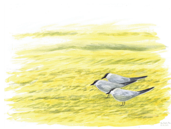
11 - Sterne hansel, Maroc, 2012