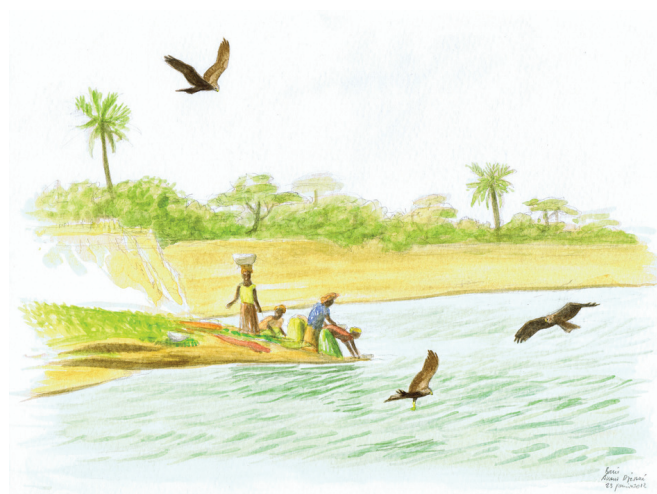
13 - Milan noir, Bani, Mali 2012