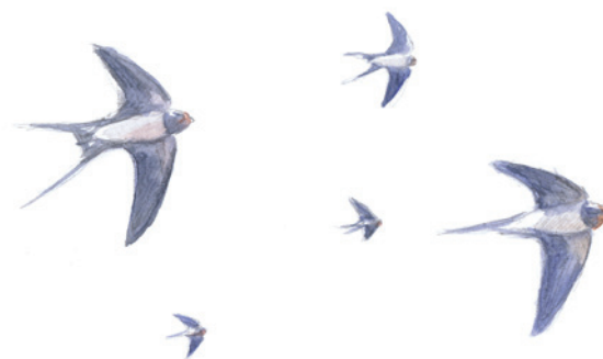
2 - Hirondelles rustiques, Riaz