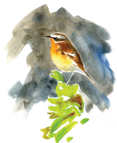
8 - Tarier des prés, Guinée, janvier 2014