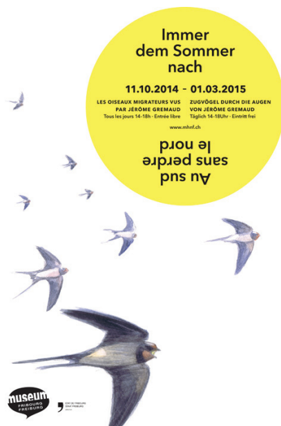
1 - Affiche de l'expo, © studio KO