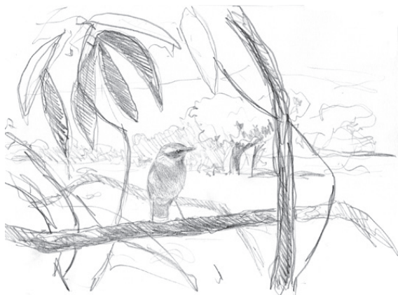
4 - Tarier des prés, Guinée, 2001