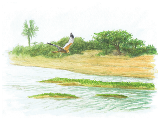
12 - Busard des roseaux, Bani, Mali, 2012

Les oiseaux migrateurs vus par Jérôme Gremaud