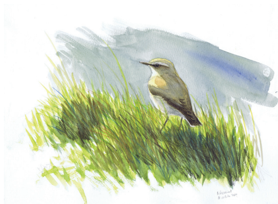
6 - Traquet motté, Niremout, oct. 2011

Les oiseaux migrateurs vus par Jérôme Gremaud