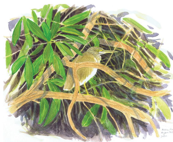
9 - Crabier, Niono, Mali, 2012