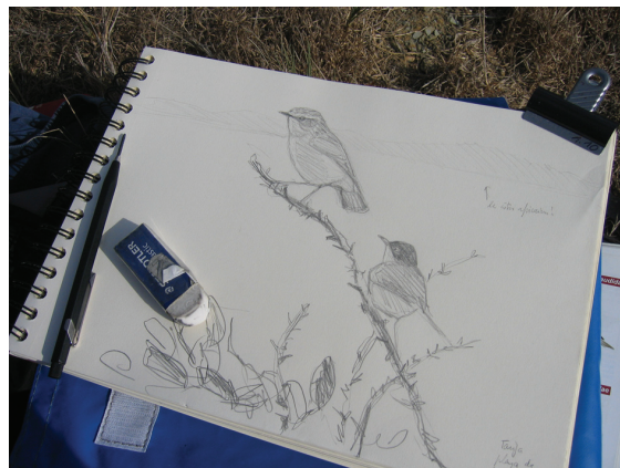
5 - Carnet de terrain