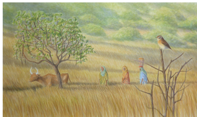
14 - Tarier des prés, Guinée, janvier 2014