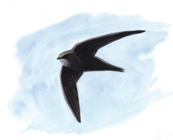
7 - Martinet noir