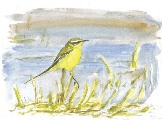
10 - Bergeronnette printanière