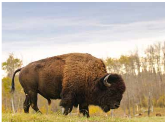
5 - Bison