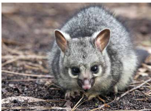
8 - Phalanger