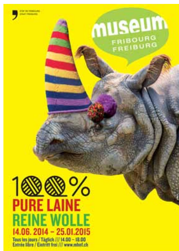
1 - Affiche de l'expo