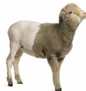
6 - Mouton