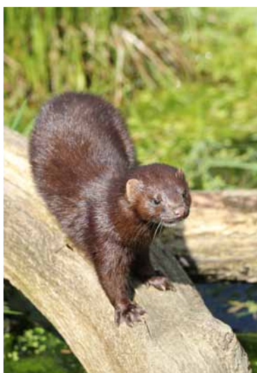
7 - Vison