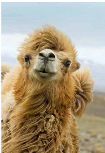
4 - Chameau