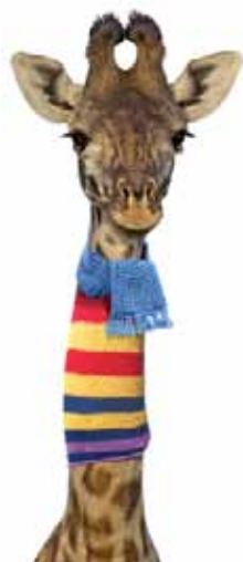
2 - sans titre © wapico