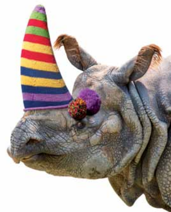
3 - sans titre