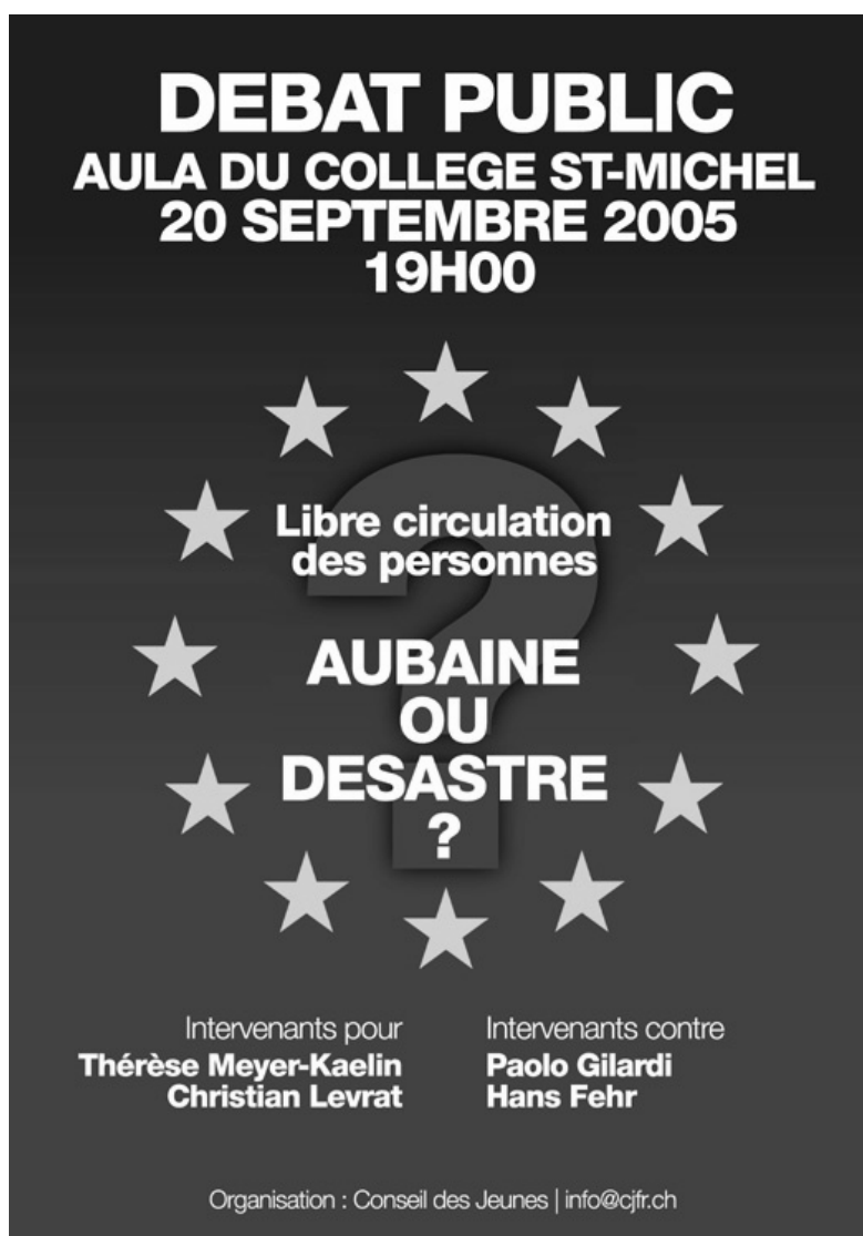
Figure 3 : Affiche pour le débat public du 20 septembre 2005