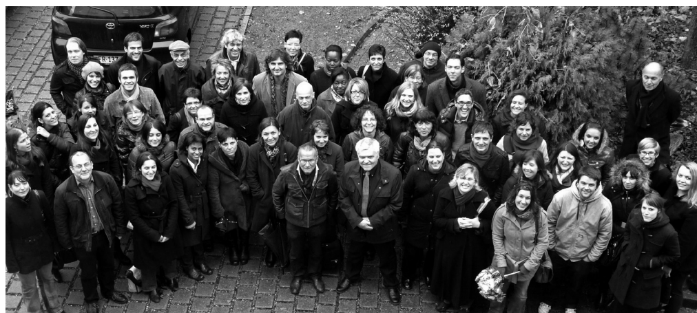
Die Mitarbeiterinnen und Mitarbeiter des JA