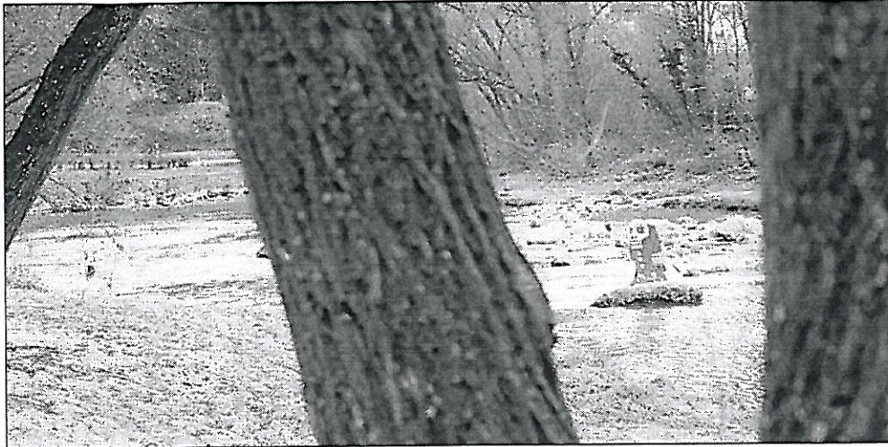
Dans la Sarine, le taux de concentration de cPCB le plus élevé est 40 fois supérieur à la valeur de tolérance en Suisse. ALAIN WICHTA