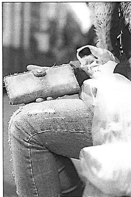
Une personne sur dix en Suisse est menacée de pauvreté.

La CSIAS avait présenté en janvier une stratégie visant à réduire de moitié la pauvreté en Suisse en dix ans. Avec son exposition itinérante, elle souhaite atteindre des couches aussi larges que possibles de la population. Une personne sur dix en Suisse est menacée de pauvreté, et un enfant sur vingt a besoin d'être soutenu par l'aide sociale. ATS