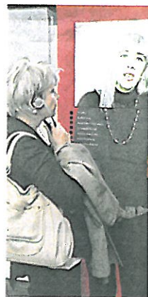
In Videoprotokollen bekommen Betroffene eine Stimme.