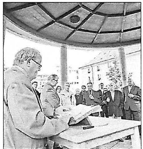
C'est au kiosque à musique de la place Georges-Python que s'est déroulée la fête pour marquer les vingt ans du parking des Alpes.