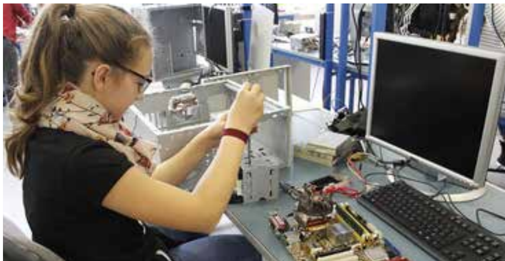
Lors de Futur en tous genres, une fille explore l'intérieur d'un ordinateur.