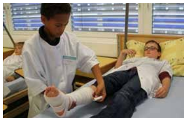
La pose d'un pansement se fait de manière concentrée.