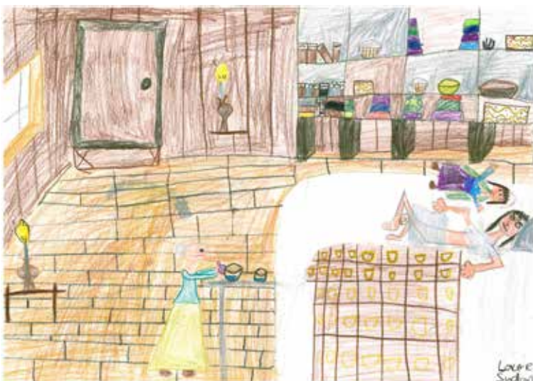
Laure Sudan, film: "La casa mas grande del mundo"