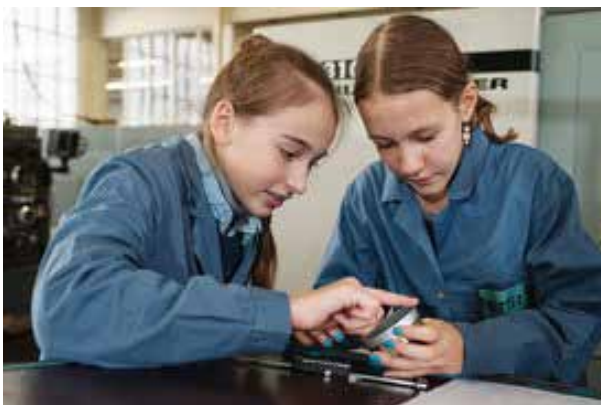
Des filles contrôlent de manière autonome la pièce qu'elles ont fabriquée.

Les écolières et les écoliers de la 7 H sont invité-e-s, pour leur part, à accompagner un-e proche sur son lieu de travail en respectant le principe de «métiers croisés». A cette occasion, des dizaines d'entreprises ouvrent leurs portes, afin de permettre aux filles et aux garçons de découvrir des métiers et des parcours de vie atypiques.