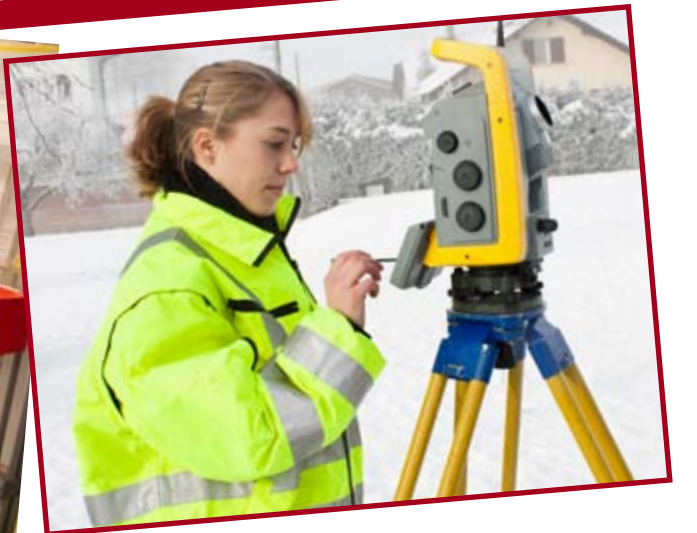
Extrait du diaporama présenté sur le stand du BEF